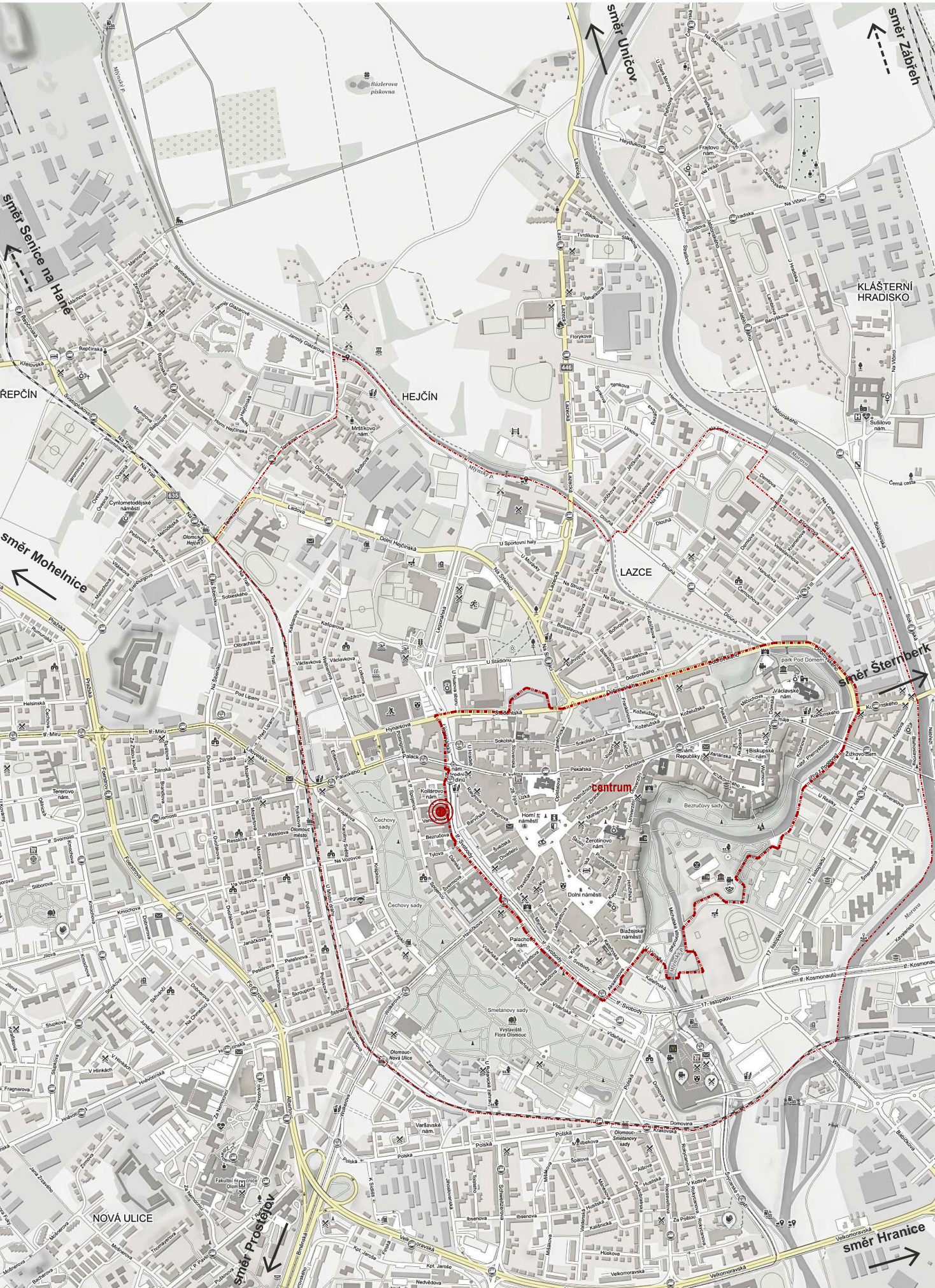
Situační výkres širších vztahů, M 1:15000